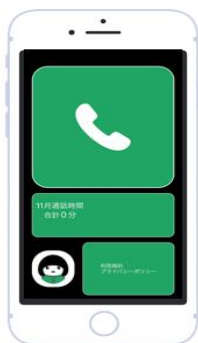
機能1. GPS位置情報を取得